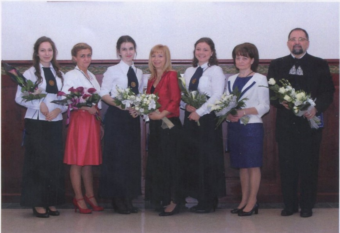
Lévay közösségi díjasok (Pro Scola et communitate)