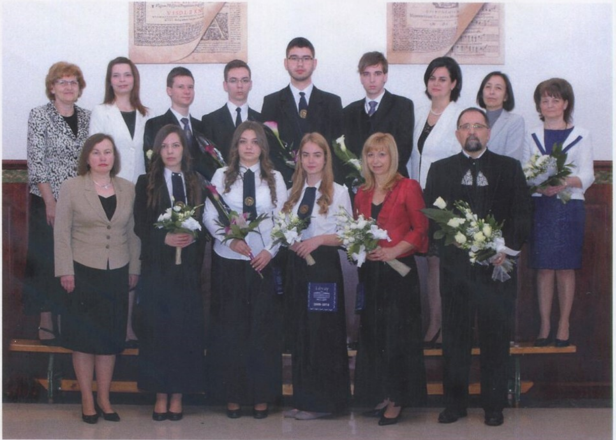
Lévay kiválósága díjasok (Pro Exellentia)