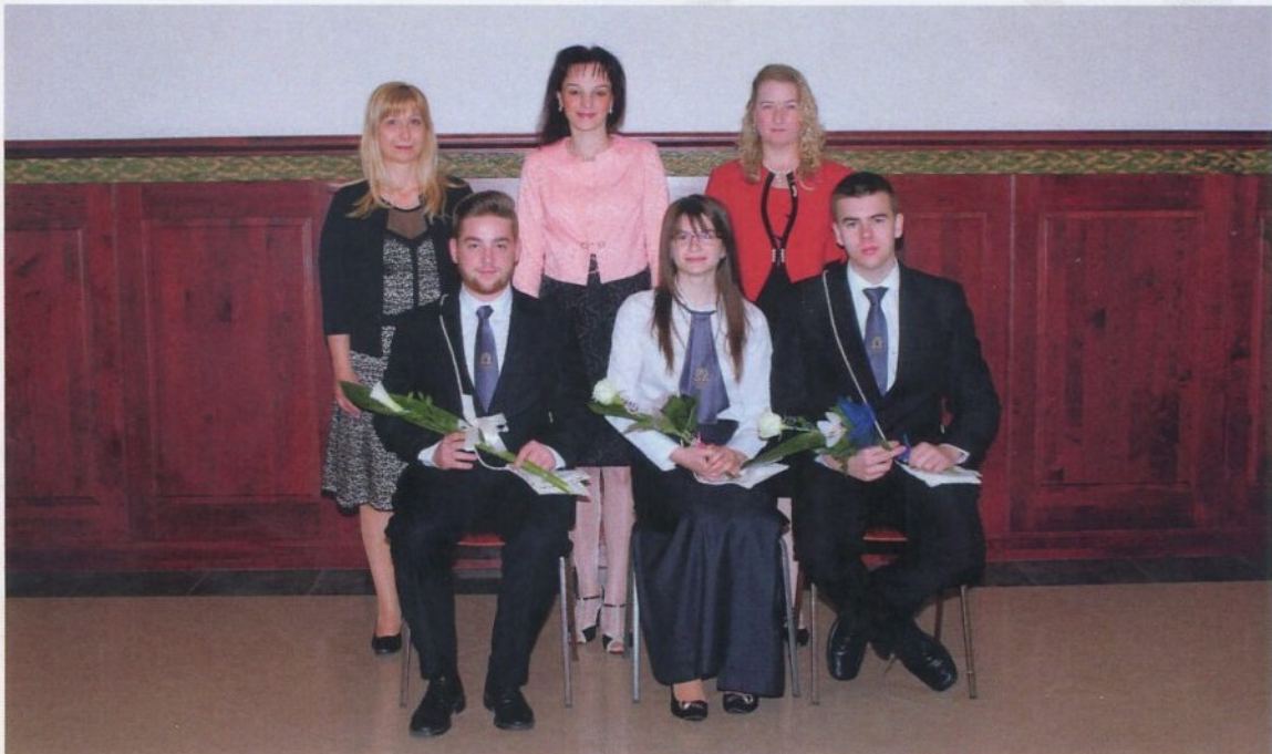
Pro Schola et Communitate díjasok