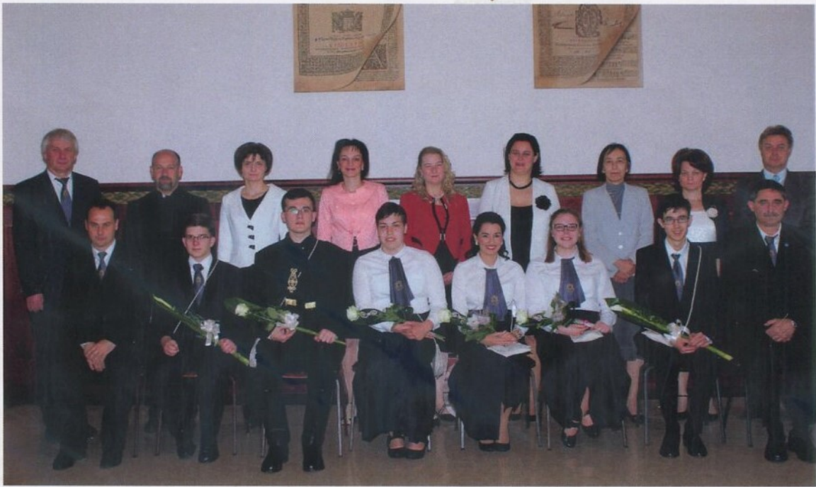
Pro Excellentia díjasok