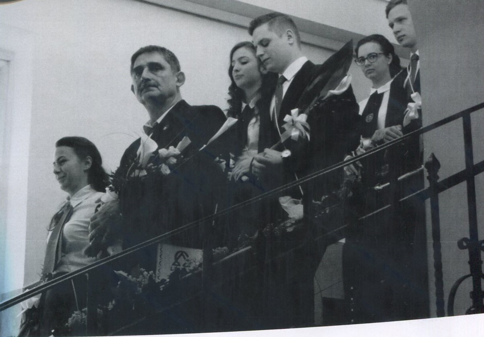
Свадьба в ресторане "Солнечный берег" 2017 Свадьба в ресторане "Солнечный берег" 2017