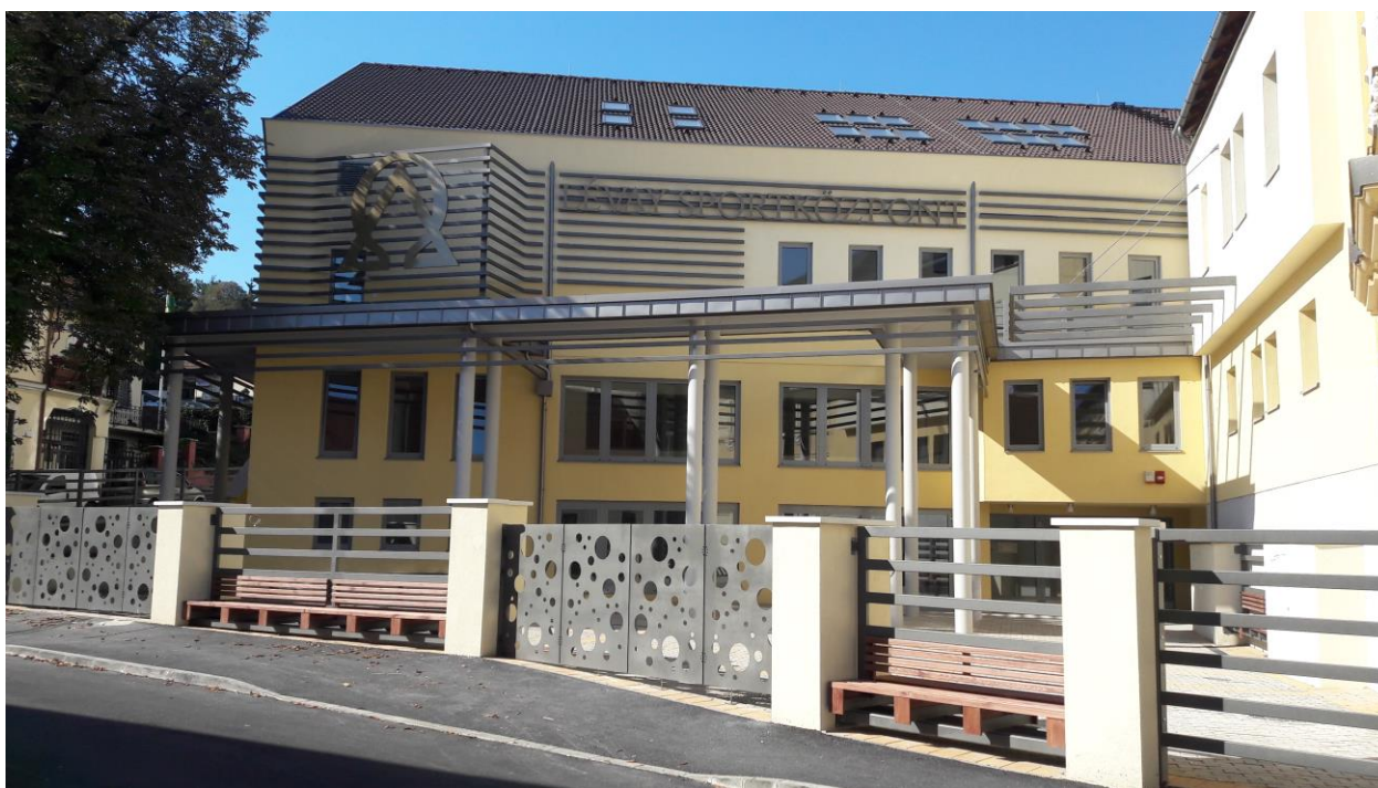
Rákóczi utcai homlokzat, uszodabejárat, teresedés – Keleti homlokzat A Rákóczi utcai műemlék környezetnek a beruházással városképi rehabilitációja is megtörténik (megvalósult)