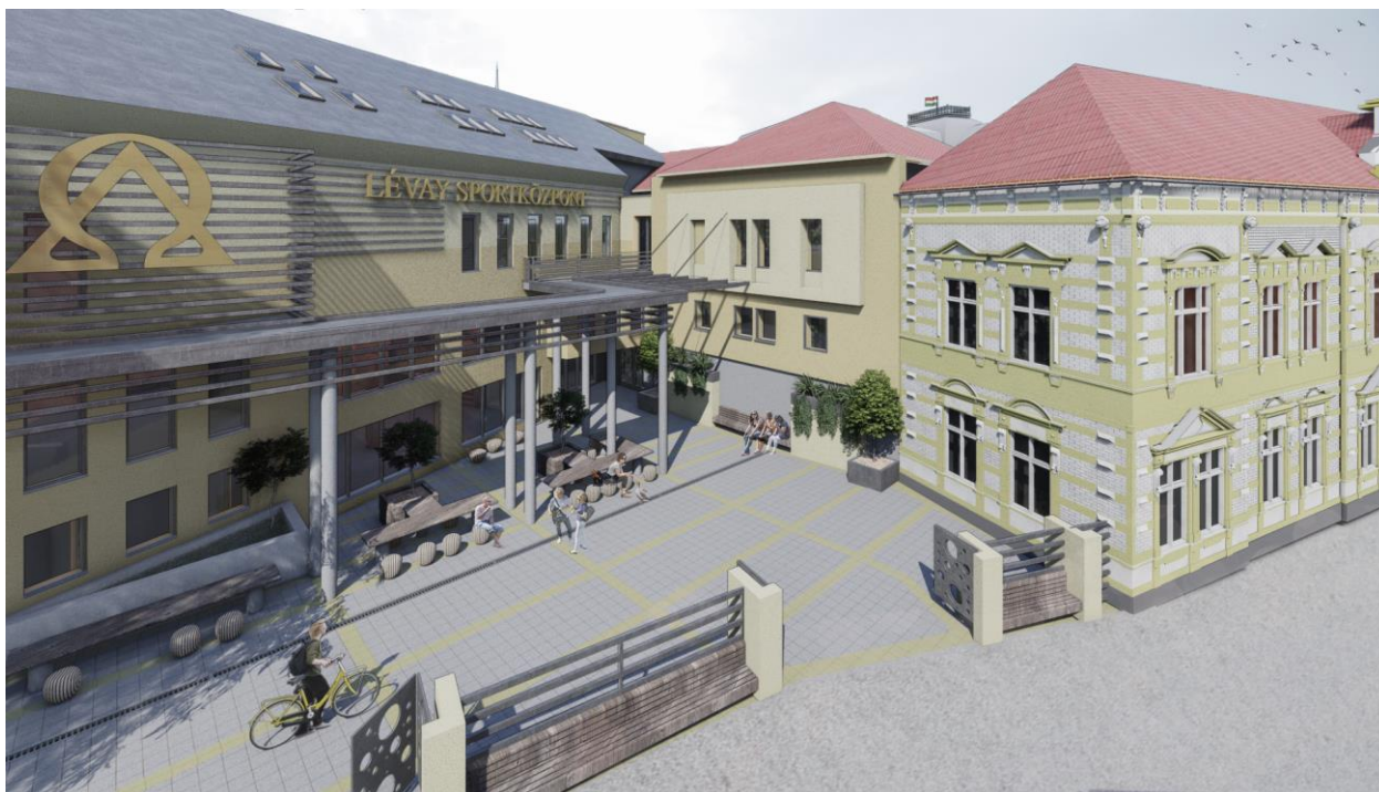
Rákóczi utcai homlokzat, uszodabejárat, teresedés – Keleti homlokzat A Rákóczi utcai műemlék környezetnek a beruházással városképi rehabilitációja is megtörténik (terv)

A sportcsarnok 40x20 m alapterületű, szabvány méretű kézilabda pályát tartalmaz. Három részre osztható elválasztó függönyökkel.