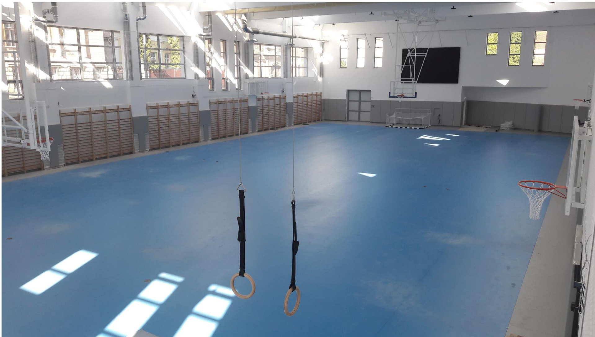
A sportcsarnok a pályavonalazás előtti állapotban