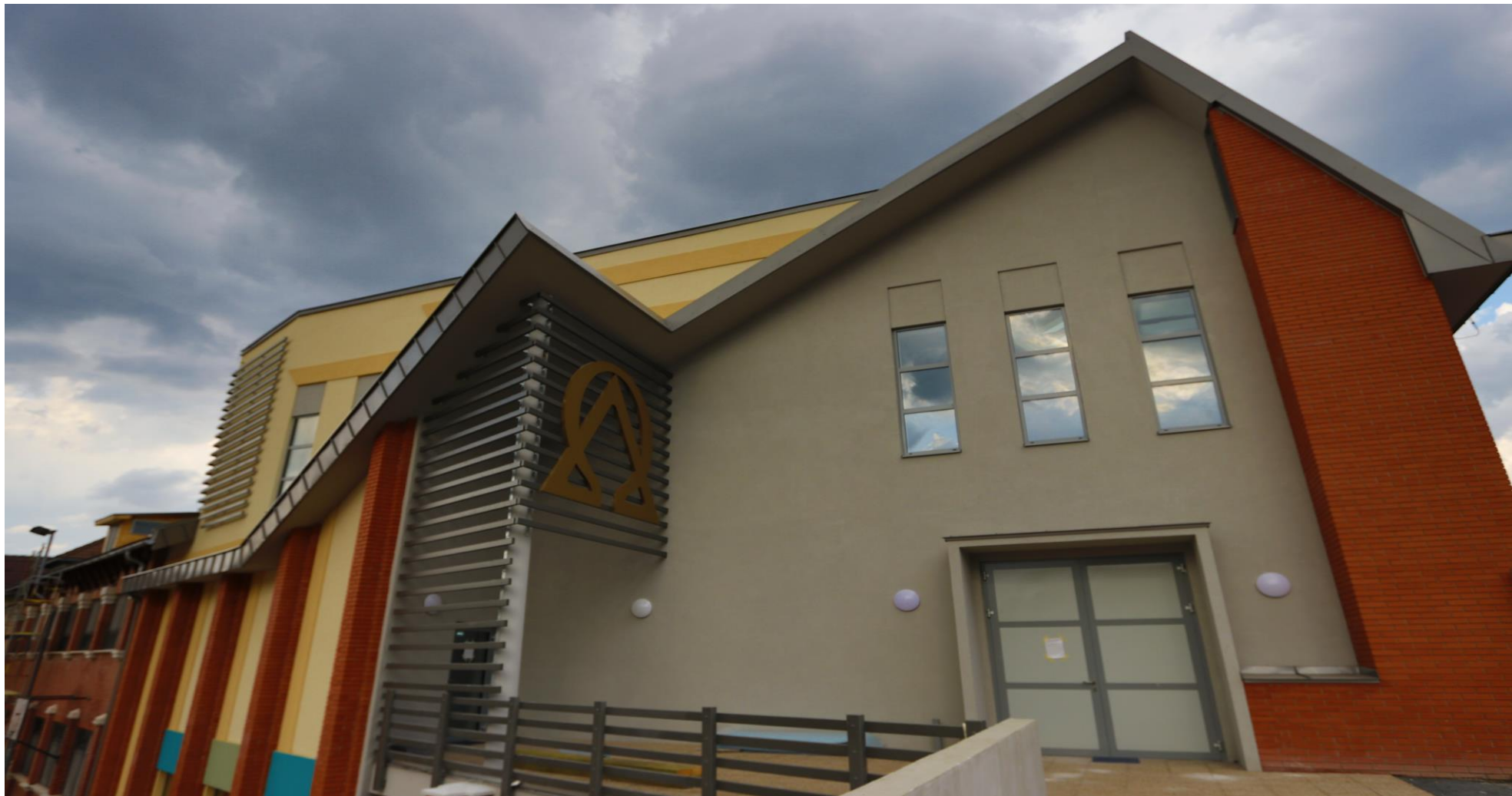
Lévy Sportközpont – nyugati homlokzat