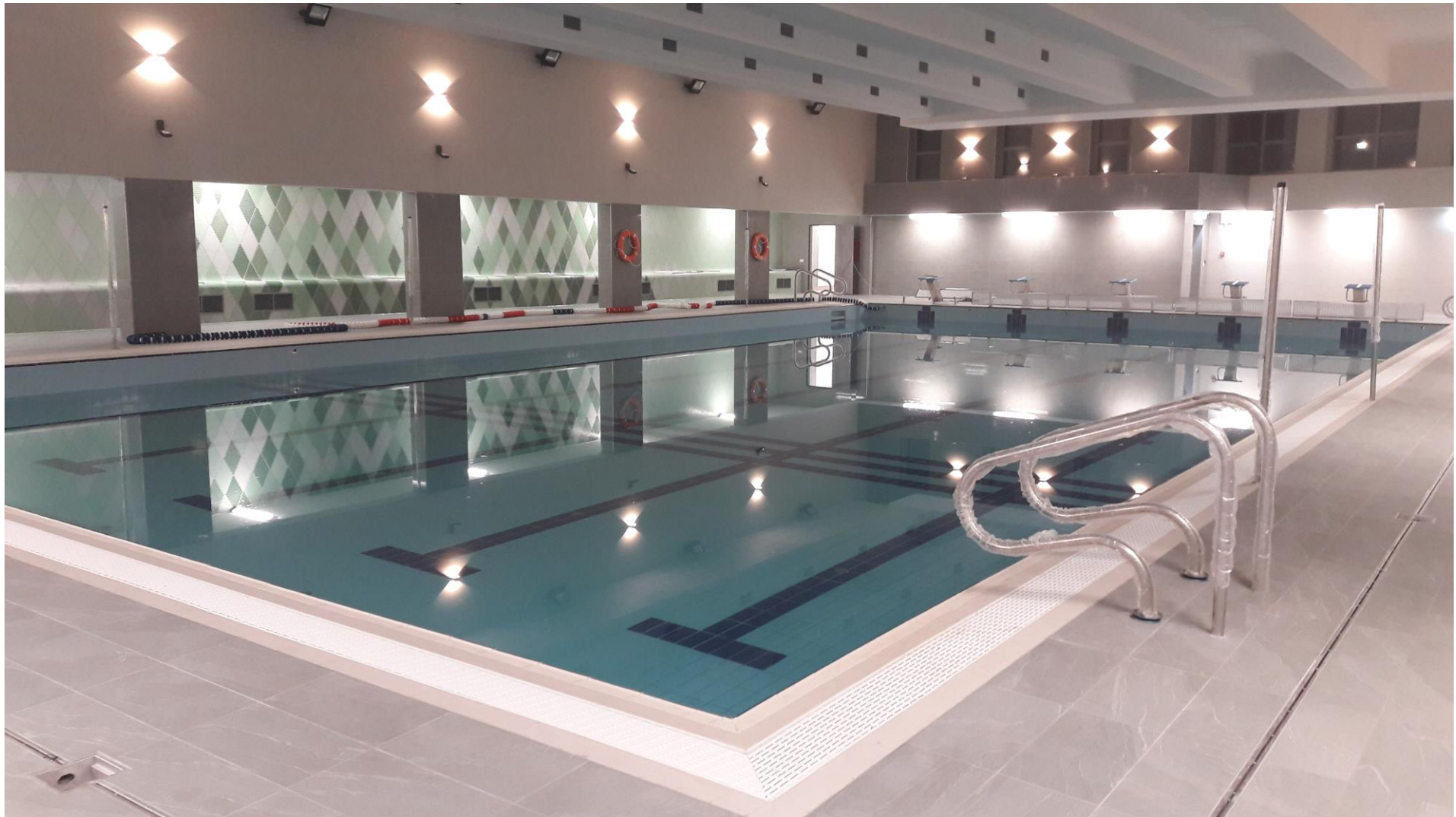
A 25 m-es ötsávos 130-160 vízmélységű medencével rendelkező uszoda