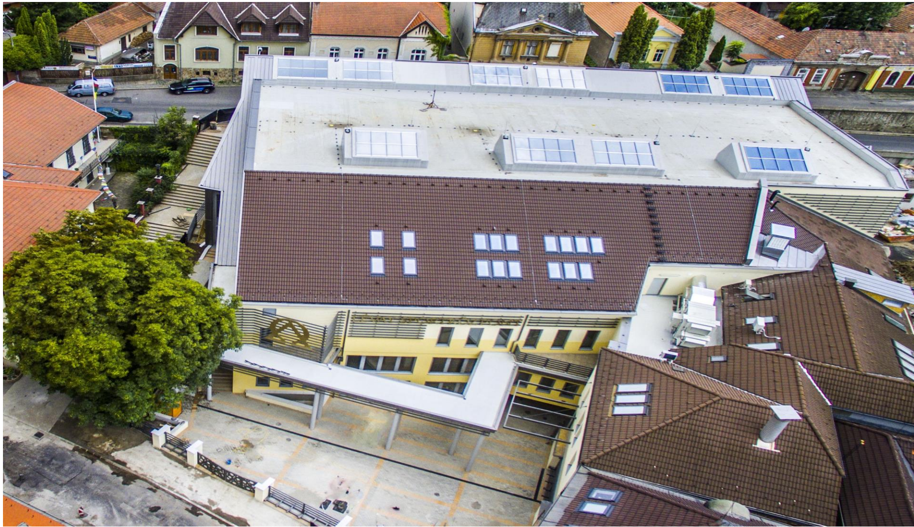
A Sportközpont légi felvétele